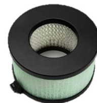
HEPA 13 Filter